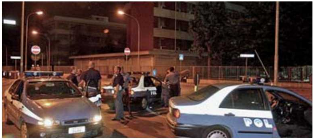
Passato La polizia in via Anelli negli anni bui del Bronx. Ora il Siulp chiede la chiusura del commissariato